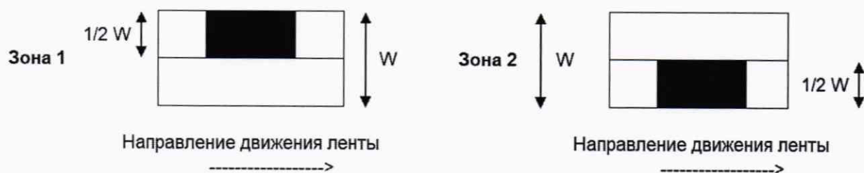
Рисунок 1 — Расположение испытательных нагрузок при оценке погрешности в режиме динамического взвешивания объектов измерений при их нецентрированном положении при движении по конвейерной ленте

зона 2 — от центра ГПУ к противоположному краю транспортной системы.