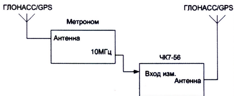
Рисунок 1 – Схема для измерения относительной погрешности по частоте выходного сигнала 10 МГц

7.3.1.2 Перед проведением поверки поверяемое устройство следует выдержать во включенном состоянии (с подключенной антенной) в течении 2 часов с целью установки рабочего режима.