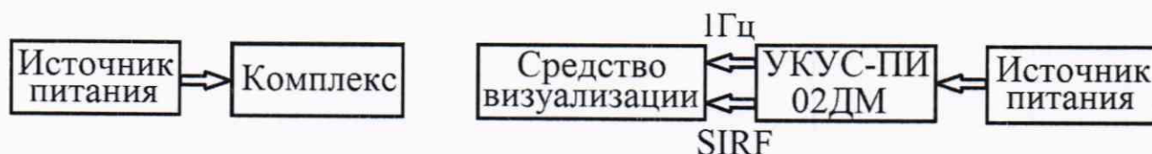
Рисунок 1 – Схема проведения измерений при определении допускаемой абсолютной погрешности привязки текущего времени комплекса к шкале времени UTC(SU)

8.5.1 Собрать схему в соответствии с рисунком 1.