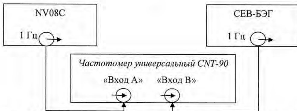
Рисунок 2 – Схема определения абсолютного смещения собственной ШВ относительно ШВ UTC(SU) в режиме синхронизации по сигналам КНС ГЛОНАСС/GPS

7.3.5.2 На вход частотомера «Вход В» подать импульсный сигнал 1 Гц от СЕВ-БЭГ, на вход частотомера «Вход А» подать импульсный сигнал 1 Гц от аппаратуры навигационно-временной потребителей глобальных навигационных спутниковых систем ГЛОНАСС/GPS NV08С. Частотомер универсальный CNT-90 установить в режиме измерений интервалов времени. Настроить входы «А» и «В» в соответствии с параметрами импульсных сигналов 1 Гц: