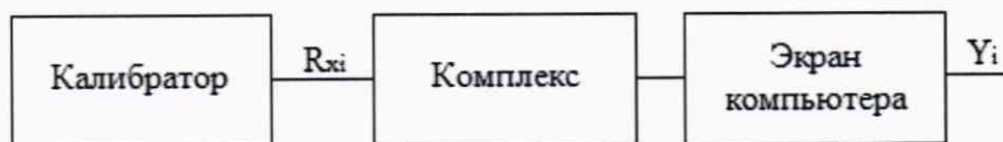
Рисунок 4 - Схема подключений при определении погрешностей ИК, реализующих аналого-цифровое преобразование сигналов от термопреобразователей сопротивления.

где X_n - нормирующее значение, соответствующее диапазону преобразования.