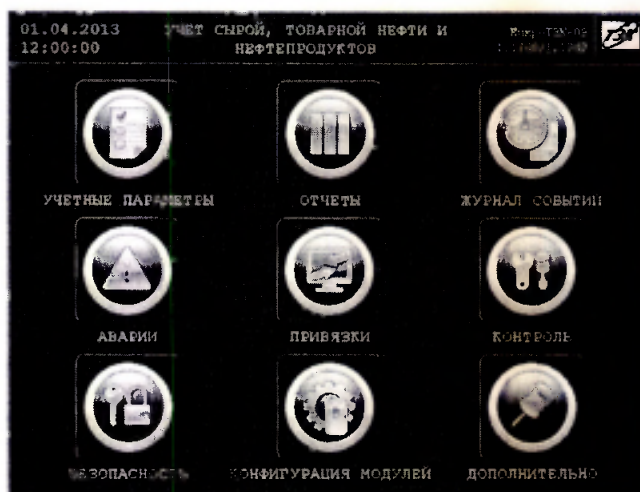
Рисунок 1 – Идентификационные данные ПО

8.5.1.2 Проверку идентификационного наименования и номера версии ПО ИВК проводят сравнением данных, приведённых в 8.5.1.1 настоящей МП и отображаемых в верхнем правом углу главного окна дисплея ИВК (рисунок 1).