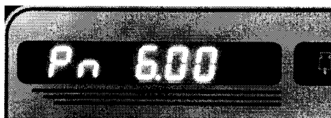
Рисунок - Идентификационный номер ПО.

Идентификация программного обеспечения осуществляется путем просмотра номера версии ПО во время прохождения теста после включения компаратора.