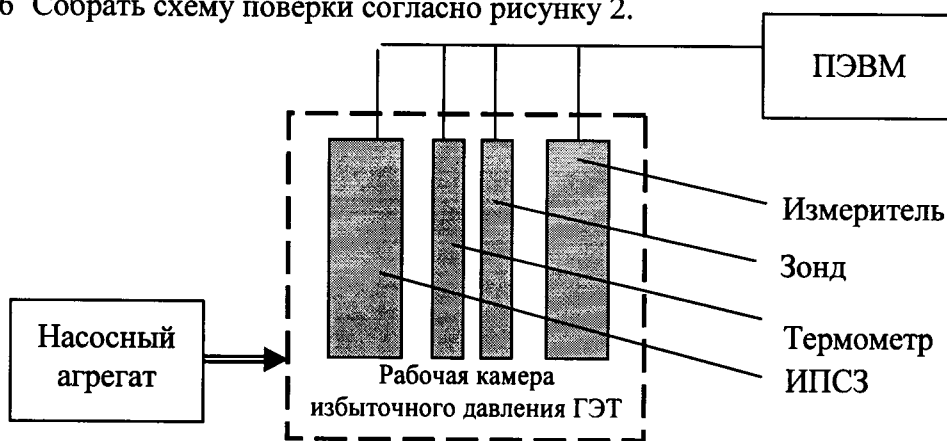
Рисунок 2 – Схема поверки при избыточном давлении.

6.3.16 Собрать схему поверки согласно рисунку 2.