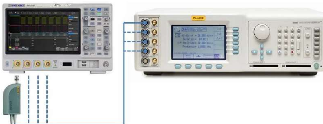
Рисунок 1 - Структурная схема соединения приборов

7.4.1 Подключить калибратор осциллографов Fluke 9500В с использованием формирователя 9530 ко входу 1 осциллографа. Структурная схема соединения приборов приведена на рисунке 1.