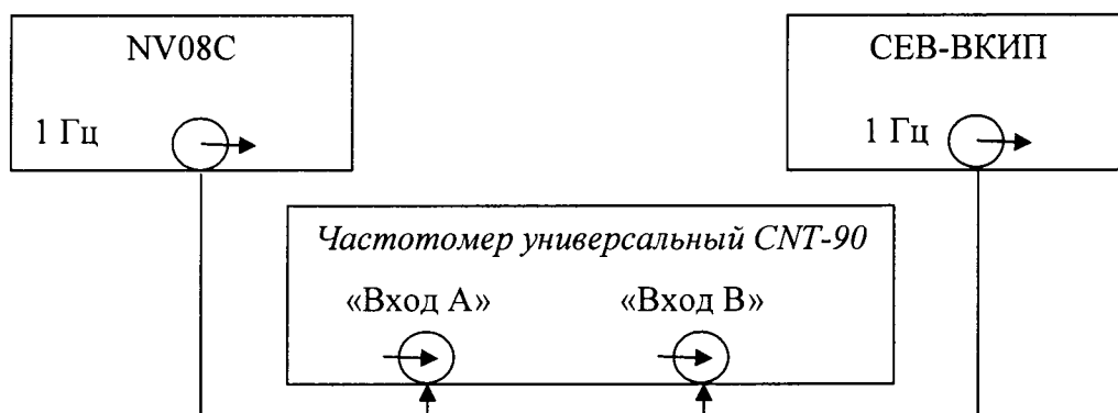
Рисунок 1 – Схема определения относительной погрешности по частоте

7.3.4.2 Включить аппаратуру навигационно-временную потребителей глобальных навигационных спутниковых систем ГЛОНАСС/GPS NV08C в соответствии с его Руководством по эксплуатации и прогреть в течении установленного времени.