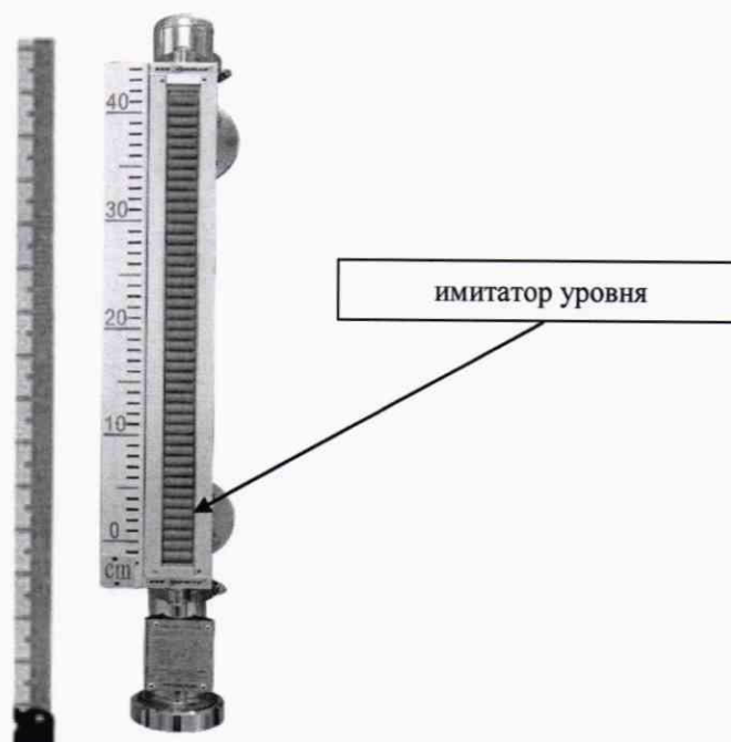
Рисунок 2 - Проверка уровнемера с имитацией изменения уровня

5.2 При периодической поверке без демонтажа