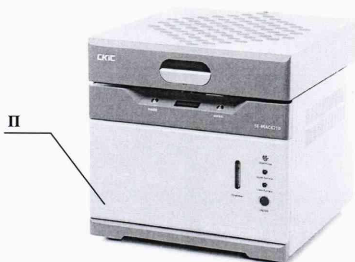
Рисунок 1 – Общий вид анализатора термогравиметрического СКІС серии 5Е-МАС (идентичен для двух вариантов исполнения, позиция «П» обозначает место нанесения знака поверки)

Общий вид анализаторов и место нанесения знака поверки представлены на рис. 1. Пломбирование анализаторов не предусмотрено.