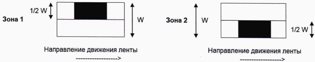
Рисунок 1 — Расположение испытательных нагрузок при оценке погрешности в режиме динамического взвешивания объектов измерений при их нецентрированном положении при движении по конвейерной ленте