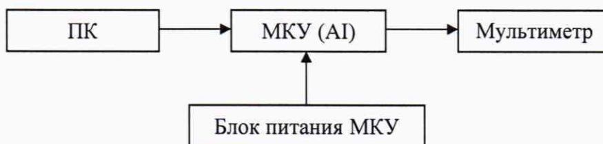
Рисунок 2 – Схема подключения ИК при воспроизведении силы постоянного тока

- сопоставляют \gamma_i с МХ ИК. Если для каждой проверяемой точки выполняется неравенство \gamma_i < |0,1| \% ( \gamma_i < |\gamma_{\text{доп}}| \% ), то ИК считают прошедшим поверку.