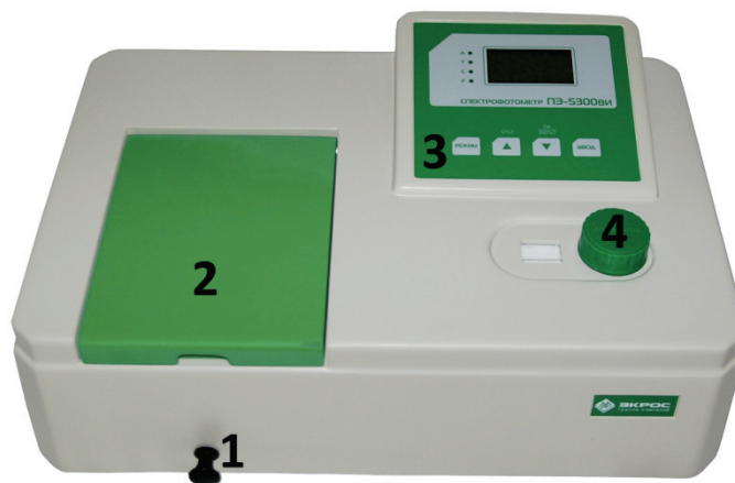
Рисунок 3 - Спектрофотометр ПЭ-5300ВИ.

Обозначения: 1 - ручка перемещения кювет; 2 - крышка кюветного отделения; 3 - панель управления; 4 - ручка установки длины волны.