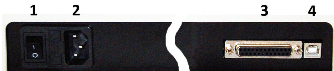
Рисунок 6 - Задняя панель прибора.

Kin5300 – программа кинетического анализа. Измерение образца на одной заданной длине волны, с заданным периодом в течение заданного промежутка времени. Может быть установлена задержка начала измерения на определенное время. При задании параметров измерения, могут быть введены коэффициенты для пересчета оптической плотности в концентрацию.