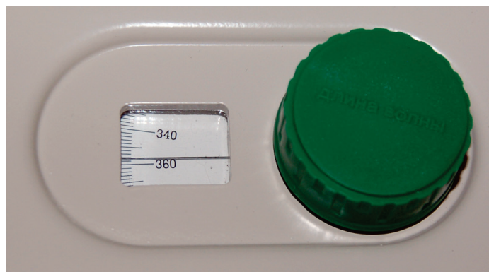
Рисунок 4 - Узел установки длины волны.

ющихся на индикаторе. В режиме F прибор запоминает значение фактора и переводит прибор в режим расчета концентрации C , значение которой будет рассчитано по формуле Cx = Ax * F .