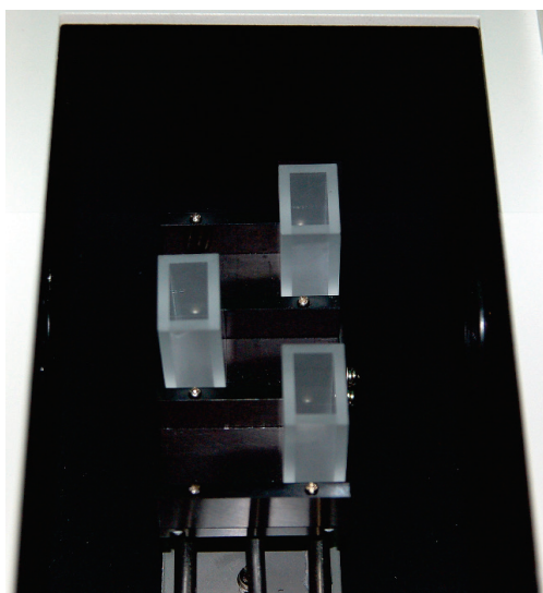
Рисунок 5 - Установка кювет в шахматном порядке.