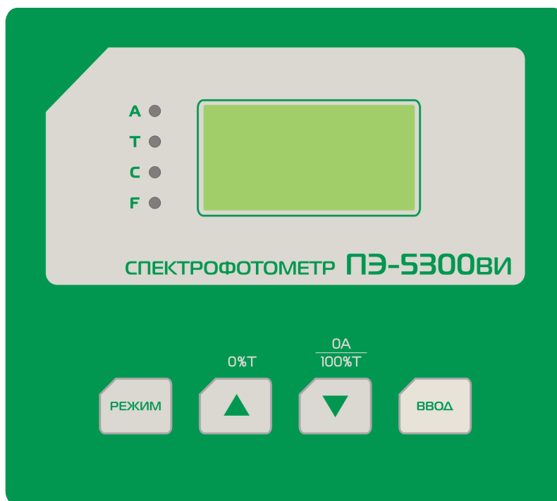
Рисунок 2 - Панель управления спектрофотометра ПЭ-5300ВИ.

Кнопка РЕЖИМ : производит переключение режимов.