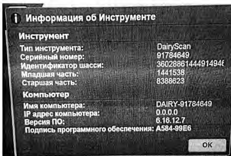
Рис.1- Окно с номером версии ПО

6.3.1.2. Анализатор считается прошедшим поверку по п. 6.3, если номер версии 6.16.12.7 или выше.