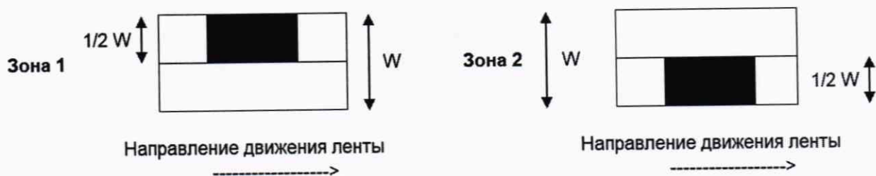
Рисунок 1 — Расположение испытательных нагрузок при оценке погрешности в режиме динамического взвешивания объектов измерений при их нецентрированном положении при движении по конвейерной ленте