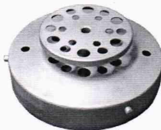
Рисунок 1 – Крышка для установки термопреобразователей диаметрами 6, 8, 10 мм (входит в комплект поставки термостата)

10.1.3.4 Отсчет эталонного значения температуры проводить с помощью эталонного термометра, подключенного к МИТ 8.