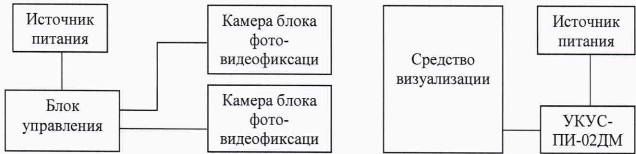
Рисунок 1 – Схема проведения измерений при определении абсолютной погрешности синхронизации внутренней шкалы времени комплексов с национальной шкалой времени UTC(SU)

10.1.1 Собрать схему в соответствии с рисунком 1.