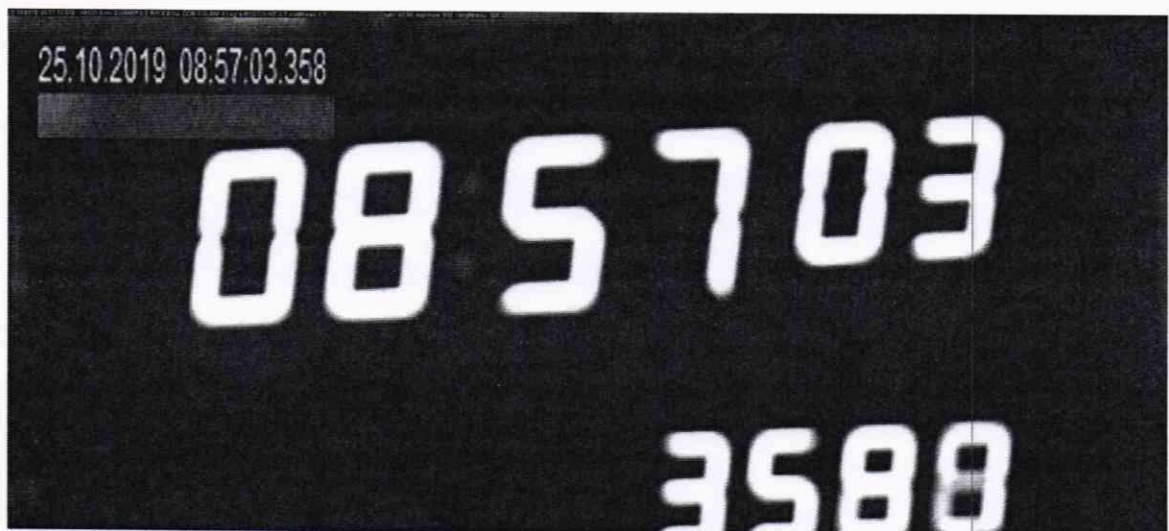
Рисунок 2 — Изображение, полученное комплексом

10.1.4 С помощью интерфейсной программы комплекса сделать не менее 5 фотографий средства визуализации в течение часа. Записать командой «PrintScreen» фото изображений, полученных комплексом в соответствии с рисунком 2.