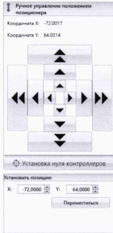
Рисунок 2 – Меню программы для ручного управления движением сканера

Перемещая антенну-зонд с установленным оптическим отражателем вдоль оси Ox в пределах рабочей зоны сканера с шагом \lambda_{min}/2 (где \lambda_{min} - минимальная длина волны, соответствующая верхней границе диапазона рабочих частот комплекса, до срабатывания механического ограничителя), фиксировать показания системы лазерной координатно-измерительной Leica AT401.