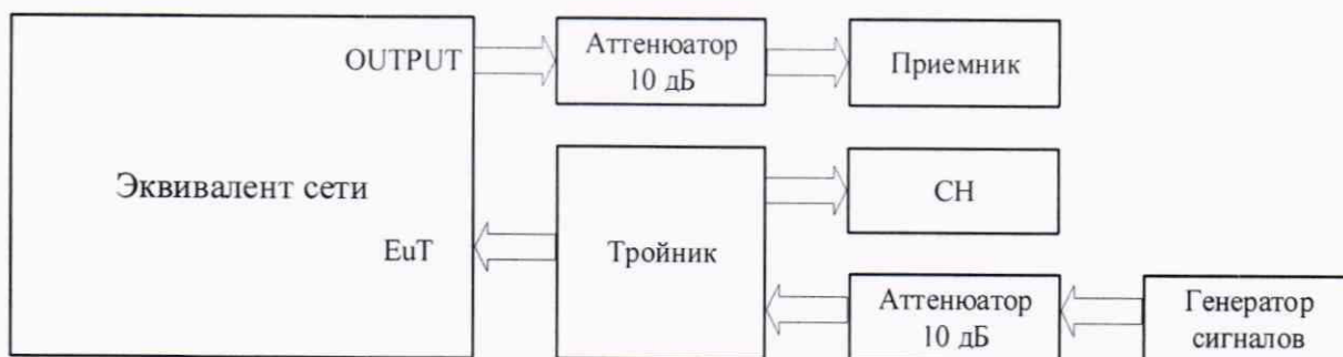
Рисунок 2 - Схема измерений выходного уровня эквивалента сети

6.3.1.4 Собрать схему измерений, представленную на рисунке 2.