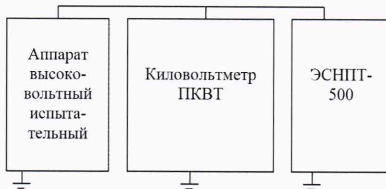
Рисунок 2 - Проверка погрешности измерений напряжения переменного тока свыше 1 кВ

10.1.2.2 Соберите схему, приведенную на рисунке 2.