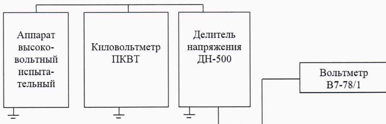
Рисунок 3 - Проверка погрешности измерений напряжения постоянного тока свыше 1 кВ

10.2.2.2 Соберите схему, приведенную на рисунке 3.