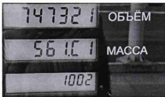
Рисунок 1 – Фотография идентификационных признаков Системы. Где «747321» – ID номер Системы, 561.61 – расширенная версия ПО, а именно «561»-версия ПО, «1002» - вариант проекта.

6.2.3 Идентификационные признаки ПО возможно считать с помощью сервисного ПО «Настройка Топаз (универсальная)», разработанного ООО «Топаз-сервис». Для этого на компьютере, установленном на рабочем месте оператора, необходимо запустить сервисное ПО «Настройка Топаз (универсальная)», ввести ID номер Системы, нажать кнопку «считать конфигурацию».