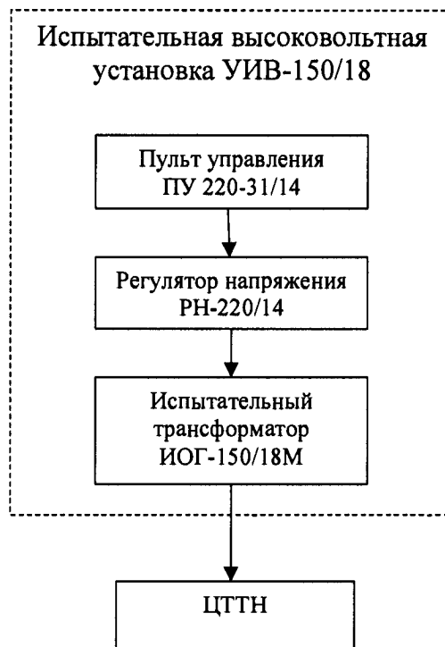
Рисунок 1 – Структурная схема определения электрической прочности изоляции