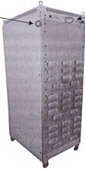
Рисунок 3 - Внешний модуль С