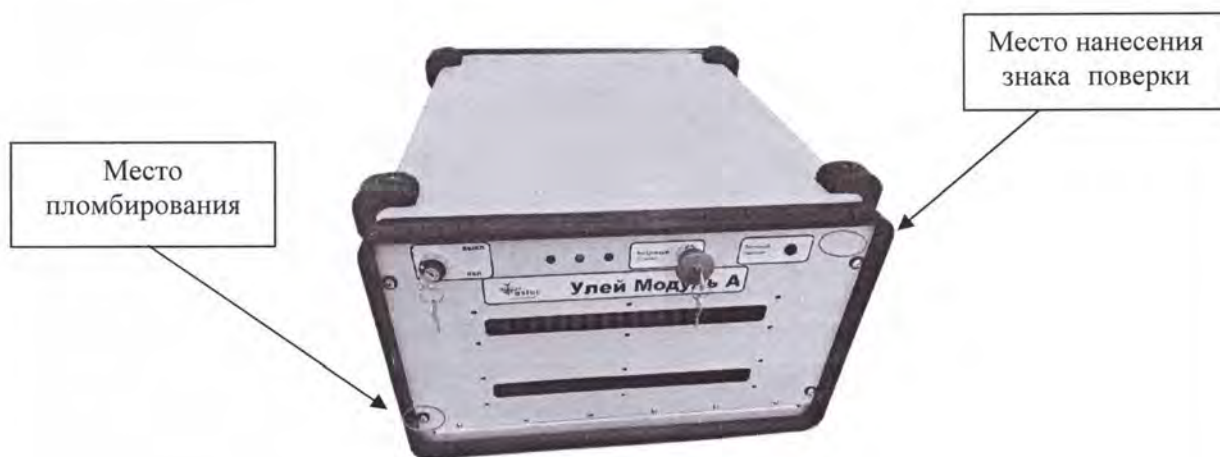
Рисунок 1 - Внешний модуль А

7.3 Внешний вид систем, с указанием места нанесения знака утверждения типа, приведен на рисунках ниже.