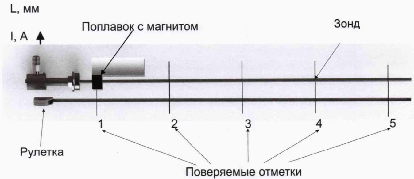
Рисунок 3 – Проверка преобразователя уровня с помощью рулетки и магнитного поплавка