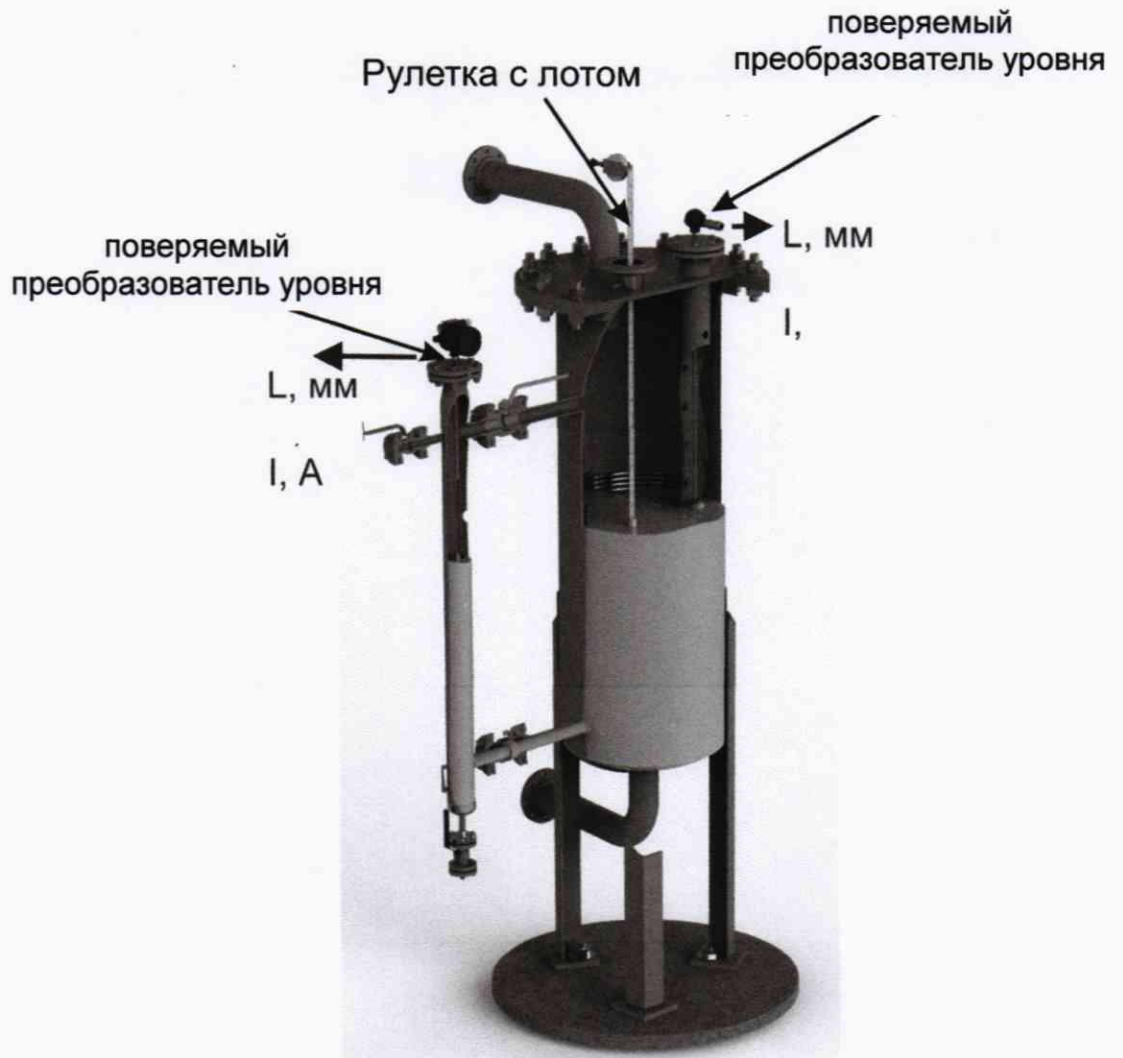
Рисунок 2 – Проверка преобразователя уровня без демонтажа с помощью эталонной рулетки с лотом