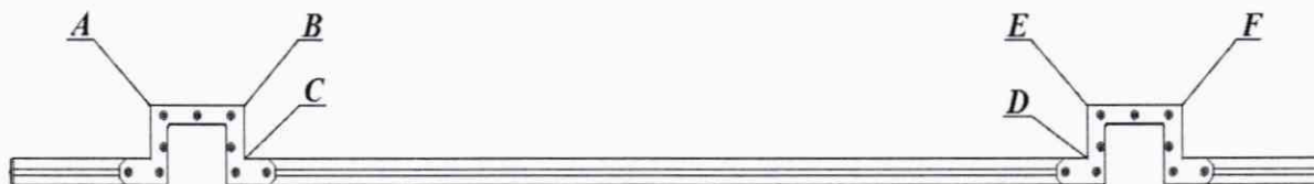
Рисунок 2 – Калибровочная линейка ДКП.999.15.061.00 с указанием контрольных точек